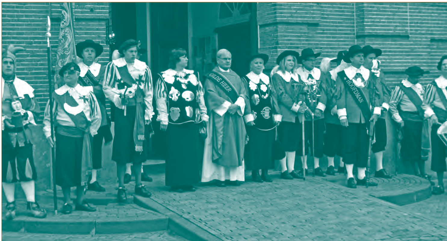
Udenhoutse traditie; de pastoor is automatisch gilde heer van beide schuttersgilden.