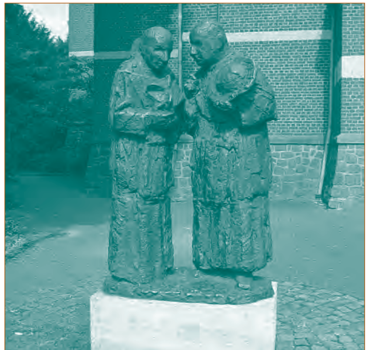
Beeld in Nijmegen

Een foto, gemaakt enkele dagen voor het conclaaf in oktober 1958, van Angelo Roncalli (de latere paus Johannes XXIII) in gesprek met de Kardinaal van Florence, Elia Dalla Costa, inspireerde hem tot het maken van drie mensgrote beelden (in Nijmegen, Zwijndrecht en Kerkrade), alsmede enkele kleinere beeldhouwwerken (o.a. in Schijndel en Driebergen) van