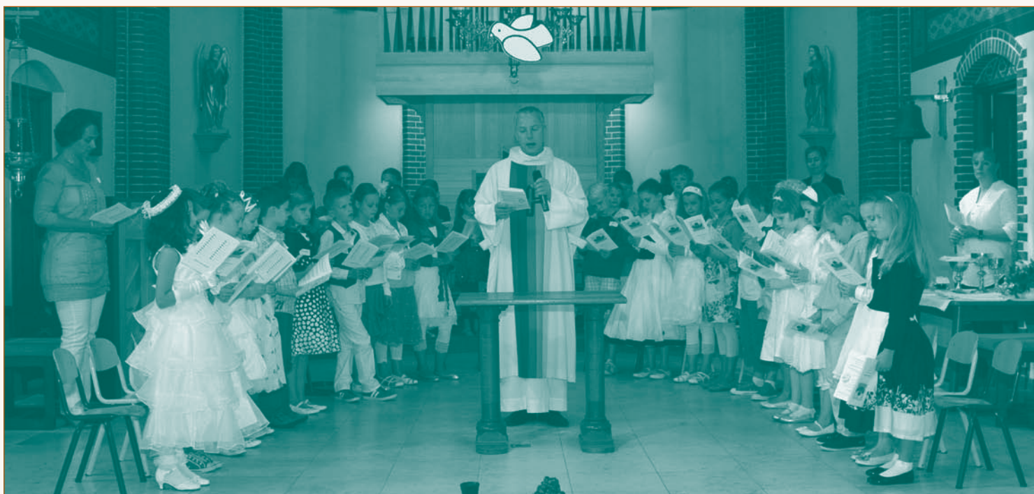
De eerste communieviering in de Caeciliakerk.